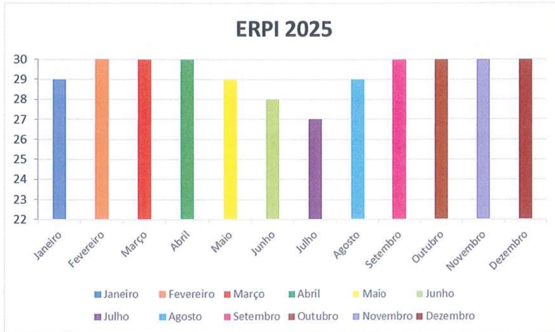
a) gráfico 1 – Frequência de utentes em ERPI

Handwritten signatures and initials in blue ink.